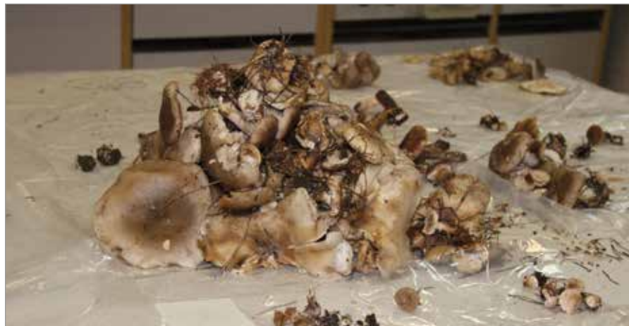
Tabella 3 - Quotazioni di mercato per le specie commercializzabili rinvenute nell'area di studio.

Secondo quanto emerso da questa indagine di mercato, i prezzi variano in base all'andamento stagionale, al gradimento delle varie specie e all'utilizzo che ne viene fatto. I dati riportati in tabella si riferiscono a prezzi medi applicati durante una stagione fungina mediamente produttiva, ovviamente in caso di poco o eccessiva reperibilità del prodotto, i valori cambiano. Il prezzo varia anche a seconda del "gradimento" della specie: in Italia funghi come le "penneccioline" non riscuotono un grande successo, fatta eccezione per alcuni mercati locali, mentre in altri paesi come la Spagna essi vengono considerati di maggior pregio dei porcini (BONET et al. 2012). Le specie del